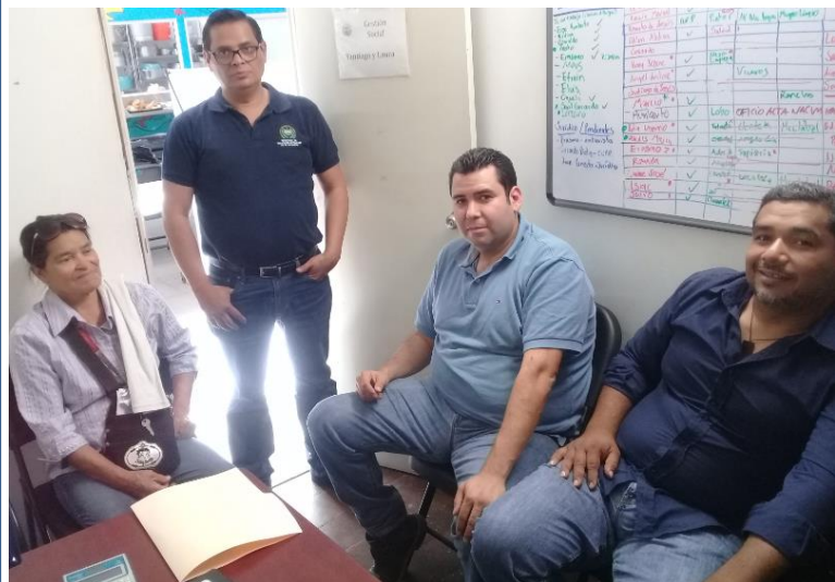
Compatriotas recibiendo atención consular

Trámites de pasaportes: 25 Poderes emitidos: 5 Actas notariales: 5 Actas de sobrevivencia: 1 Constancias de Origen: 15 Asesorías varias: 69