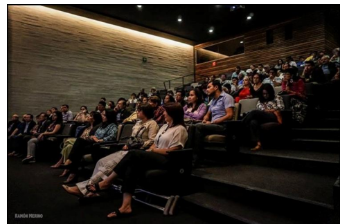
Panorama de los asistentes

El evento contó con la asistencia de miembros de la comunidad salvadoreña, representantes de diferentes ámbitos de la sociedad mexicana, miembros del cuerpo diplomático acreditado en México y todos los funcionarios de la Misión Diplomática y Consular.